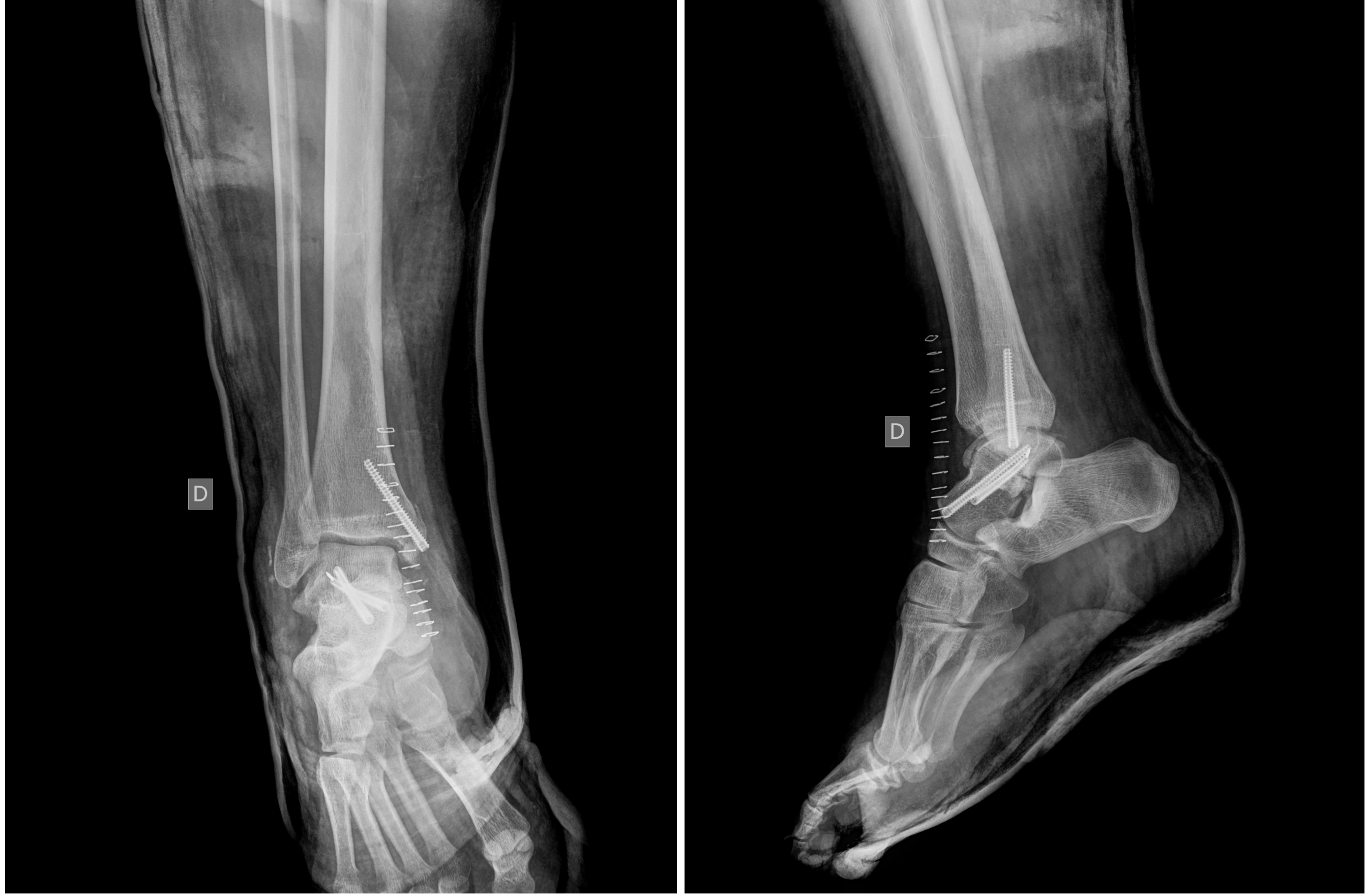
Rx : Control postIQ

Tras 6 semanas el paciente inicia fisioterapia y a las 12 semanas se permite deambulación con ayuda de muletas. 6 meses después camina sin ayudas y presenta un balance articular completo con signo Hawkins positivo en el control radiológico.