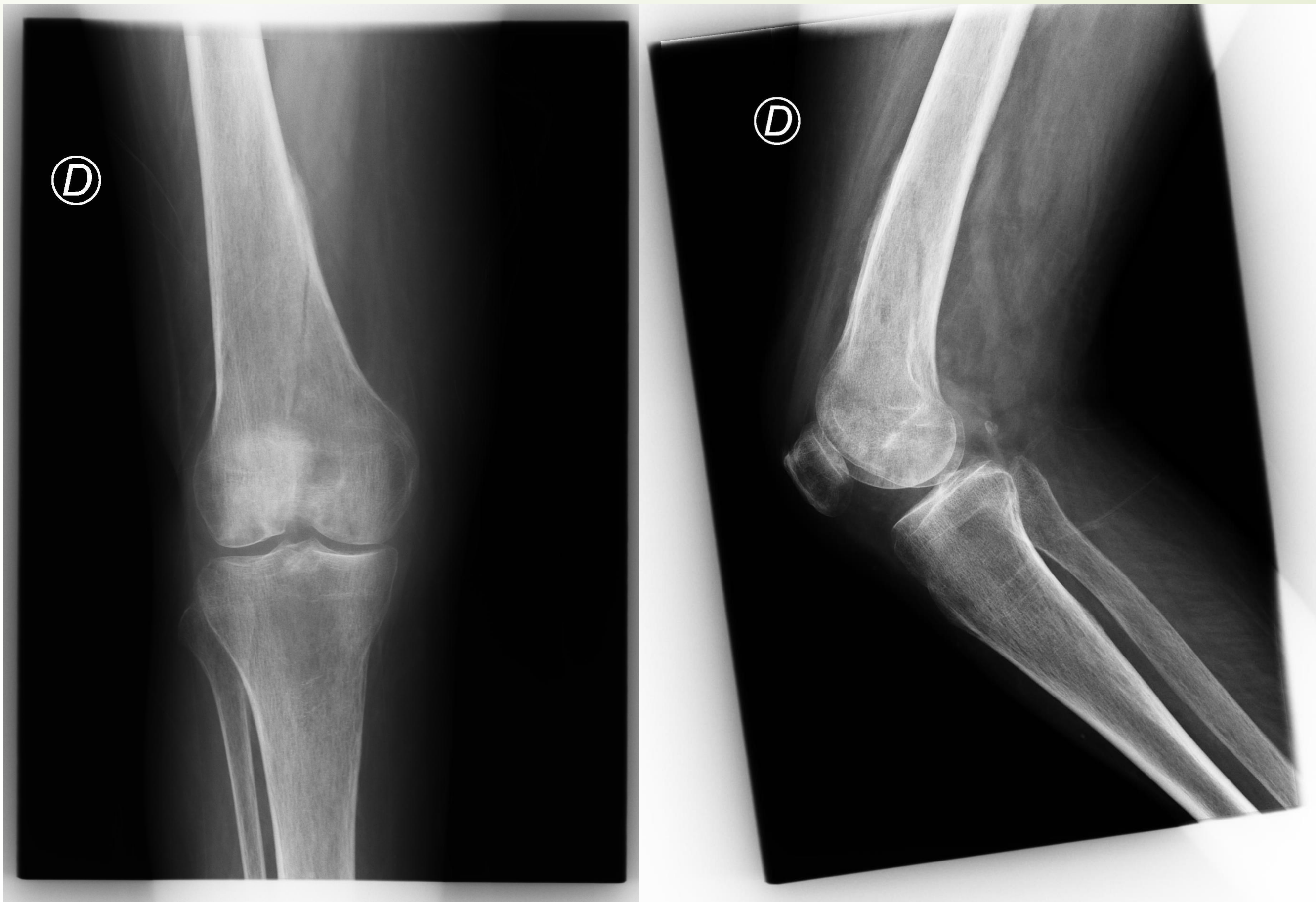
EJEMPLO CASO 1

Ver la evolución de una serie de pacientes con fracturas de extremo distal de fémur que debido a la comorbilidad de base y/o situación basal previa a la fractura se optó por un tratamiento conservador de las mismas.